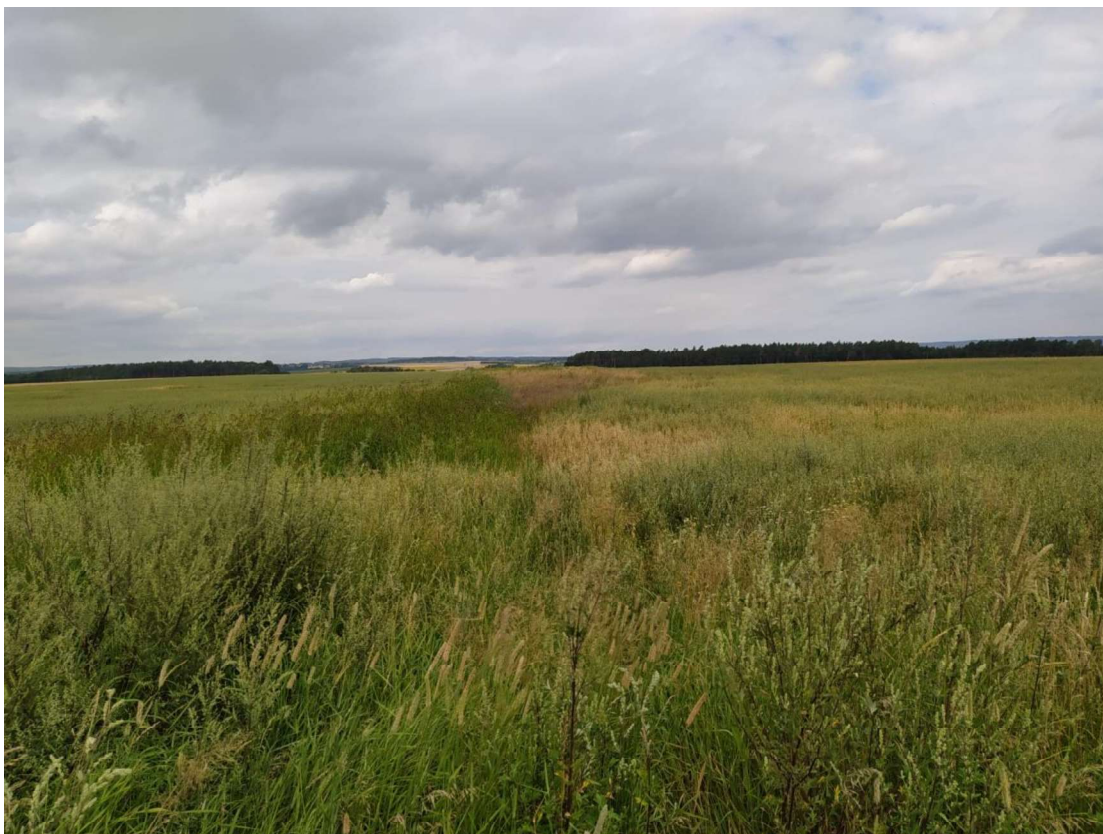
Pohled na TEO 1 – začátek úseku