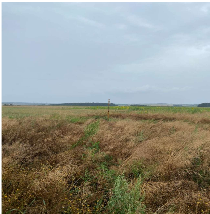
Pohled na TEO 1 – trigonometrický bod